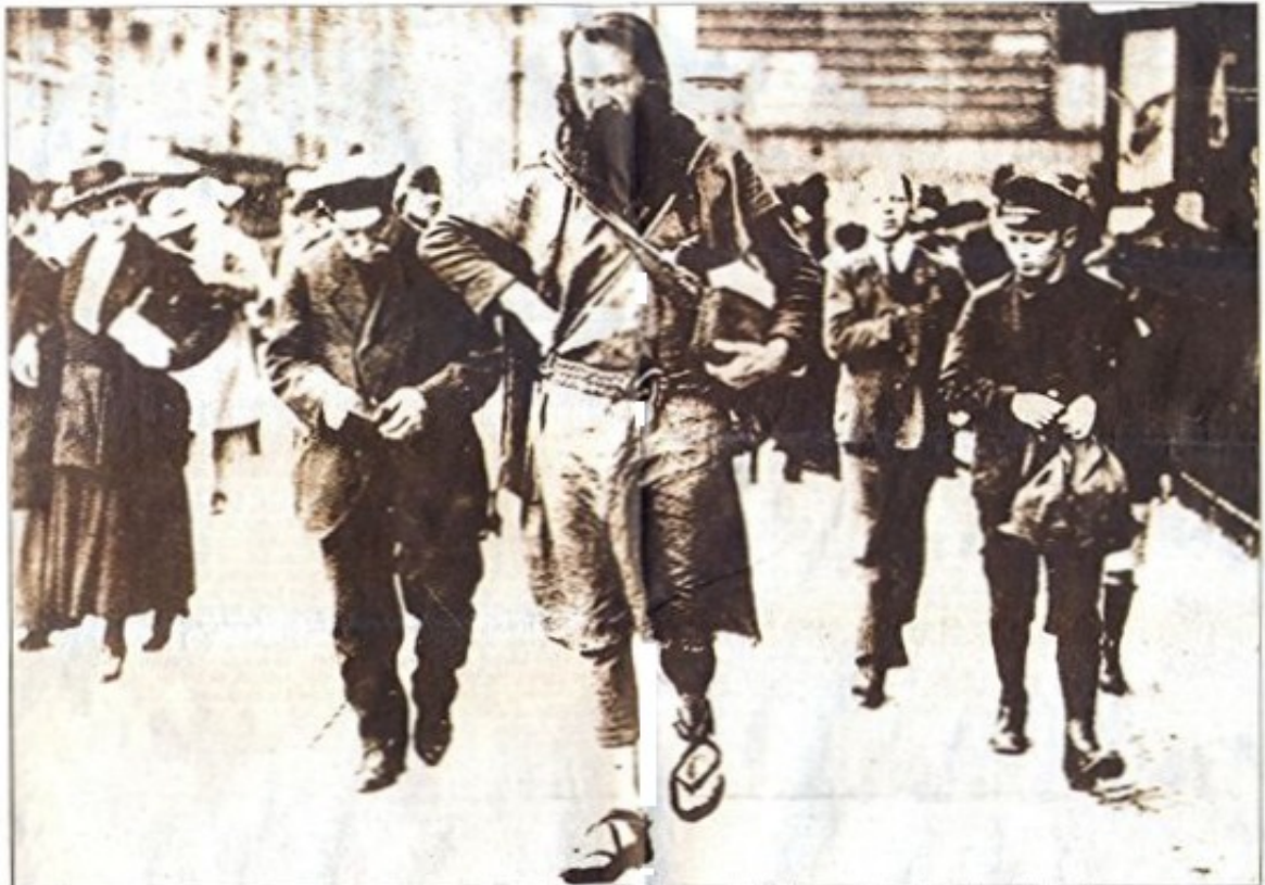
Gusto Gräser im Jahr 1928: «Er aß nur Obst, Gemüse und Brot und trank Wasser. So sanft war er, dass er nicht einmal seine Läuse und Flöhe tötete.»